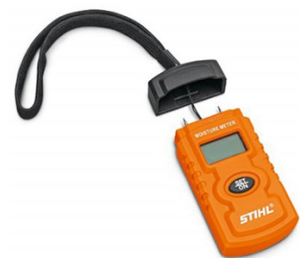
Stihl Hout Vochtigheidsmeter Artikelnummer: STH04648020010

Stook met droog hout. Meten is weten: koop een houtvochtigheids-meter. Aanwijzing bij het gebruik hiervan: kloof het te meten hout doormidden en meet dan in het midden van het kloofvlak. Het maximale vochtpercentage mag niet hoger zijn dan 20 %. Koop minimaal +/- 2 m3 hout voor elke winter. Hout moet minstens 2 jaar gedroogd zijn en droog opgeslagen worden.